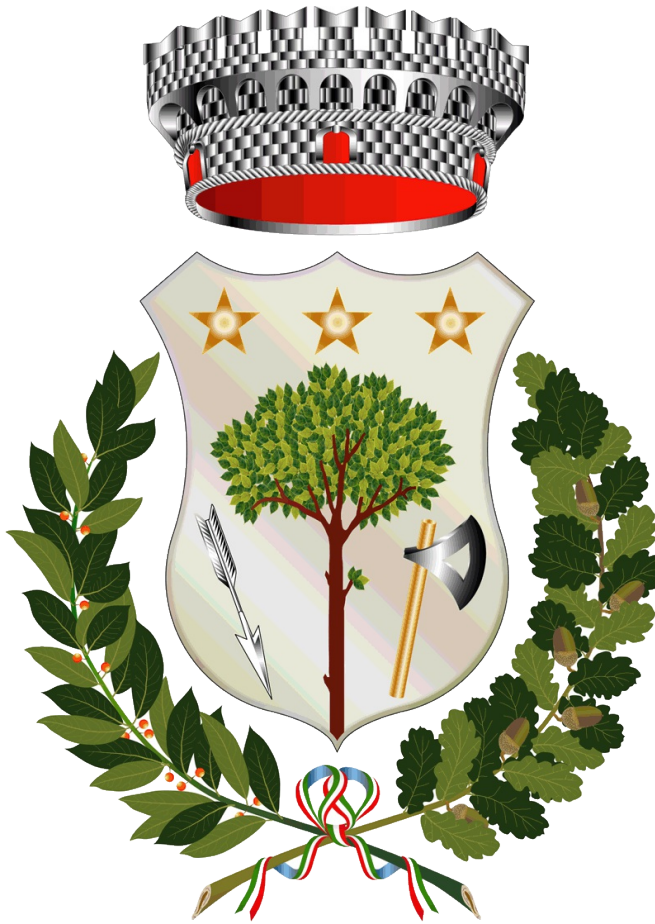
Comune di Greci