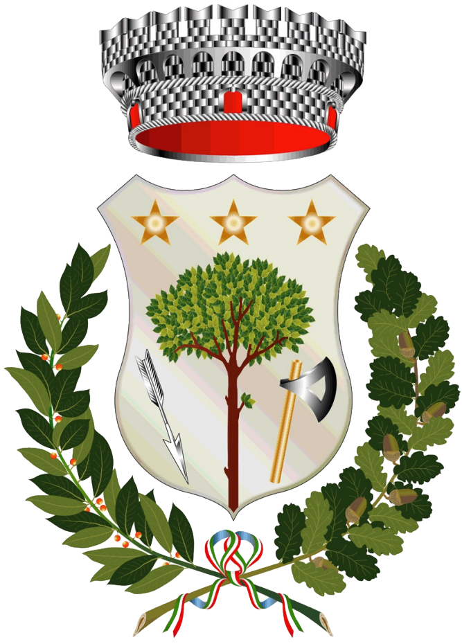
Comune di Greci