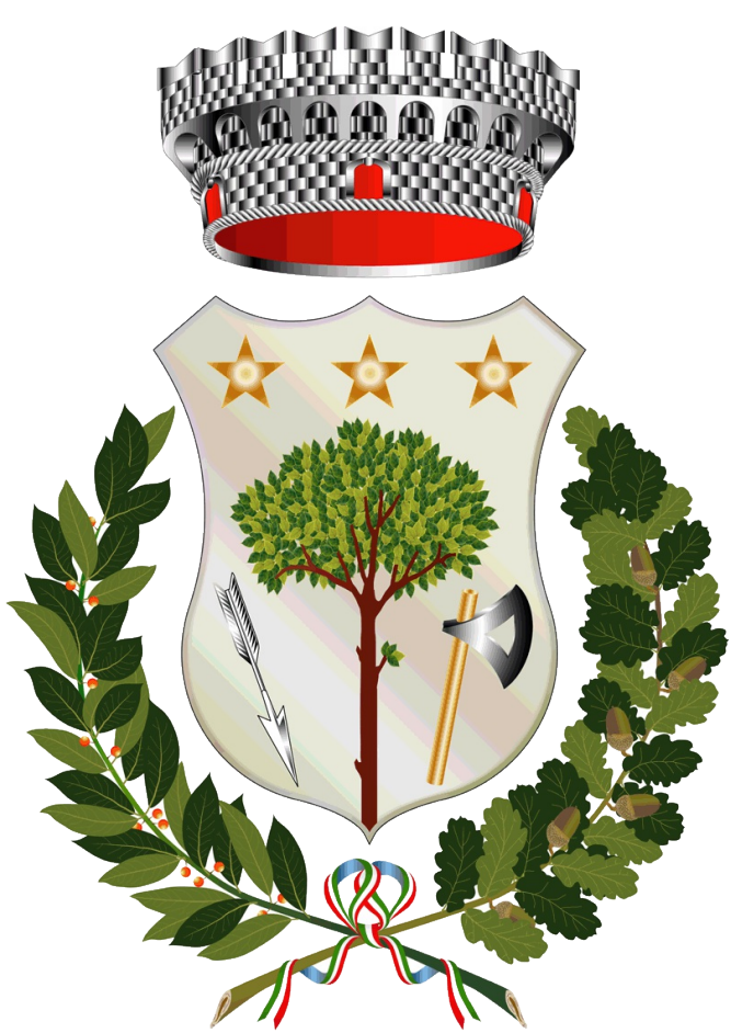
Comune di Greci